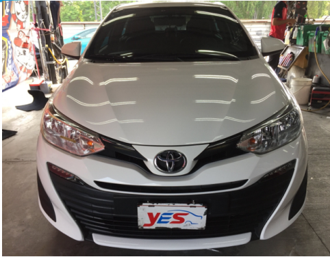
正面或左前側(含車頭)