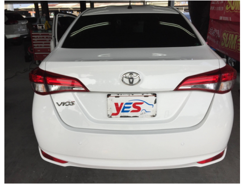
後面或右後側(含車尾)