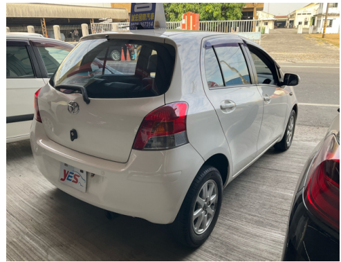
後面或右後側(含車尾)