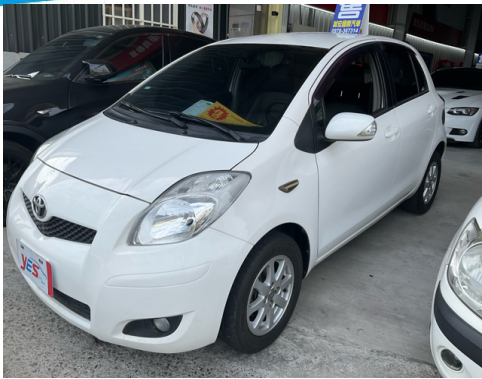
正面或左前側(含車頭)