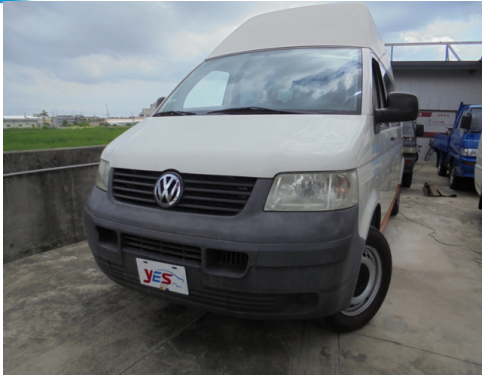
正面或左前側(含車頭)