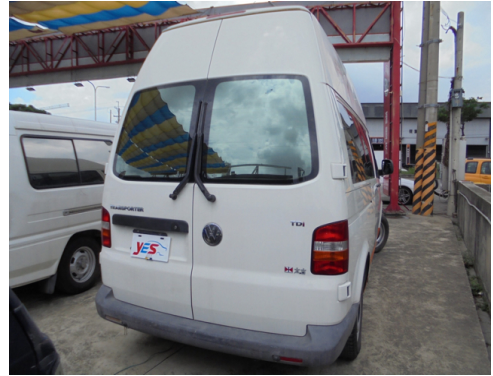
後面或右後側(含車尾)