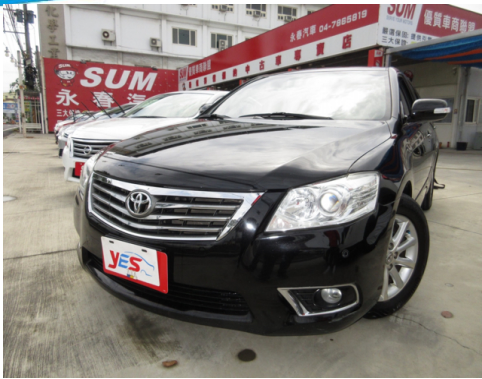
正面或左前側(含車頭)