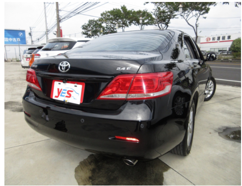
後面或右後側(含車尾)