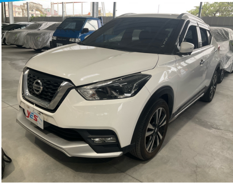
正面或左前側(含車頭)