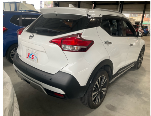
後面或右後側(含車尾)