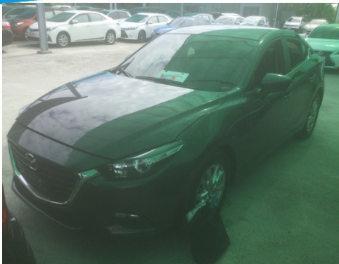
正面或左前側(含車頭)