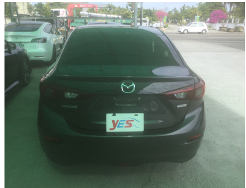
後面或右後側(含車尾)