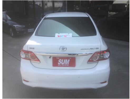
後面或右後側(含車尾)