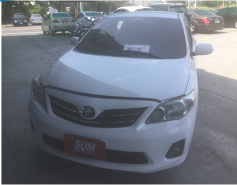
正面或左前側(含車頭)