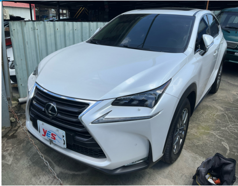
正面或左前側(含車頭)