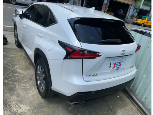
後面或右後側(含車尾)