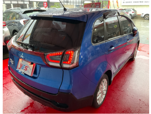
後面或右後側(含車尾)