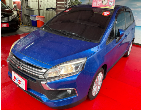
正面或左前側(含車頭)