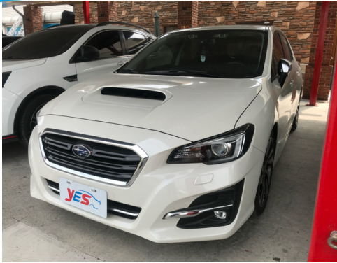
正面或左前側(含車頭)