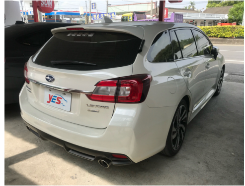
後面或右後側(含車尾)