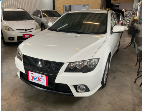
正面或左前側(含車頭)