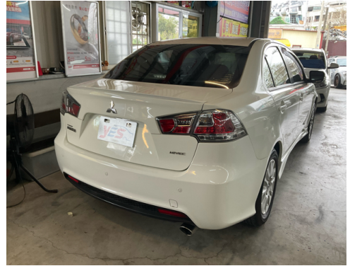
後面或右後側(含車尾)