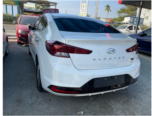
後面或右後側(含車尾)