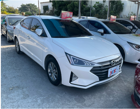
正面或左前側(含車頭)