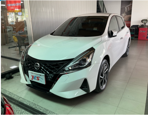
正面或左前側(含車頭)