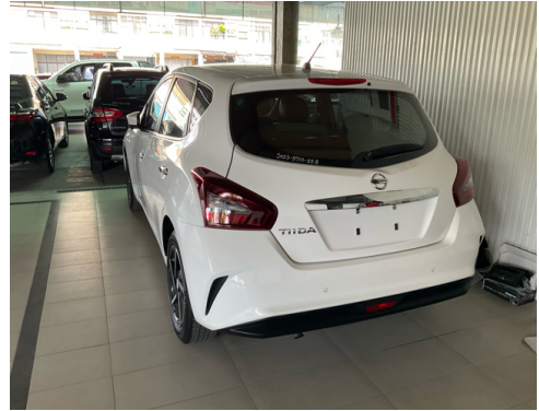
後面或右後側(含車尾)