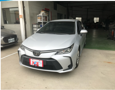
正面或左前側(含車頭)