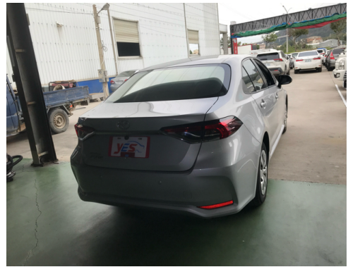
後面或右後側(含車尾)