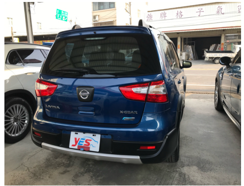
後面或右後側(含車尾)