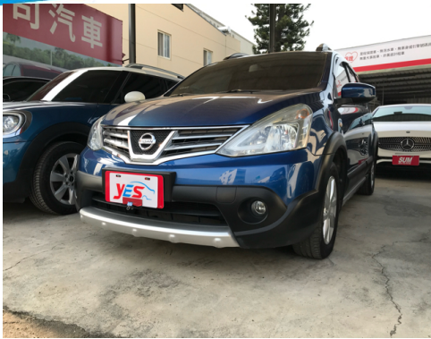
正面或左前側(含車頭)