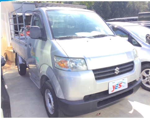
正面或左前側(含車頭)