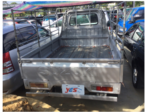
後面或右後側(含車尾)