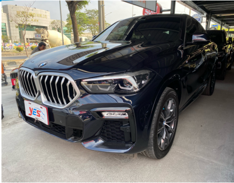
正面或左前側(含車頭)