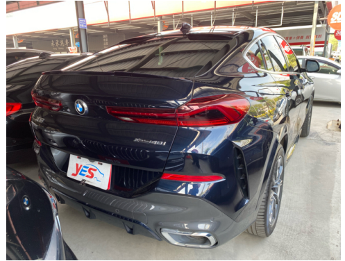
後面或右後側(含車尾)