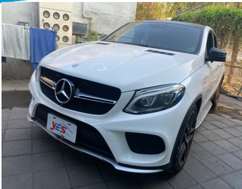
正面或左前側(含車頭)