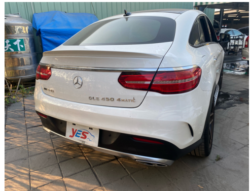
後面或右後側(含車尾)