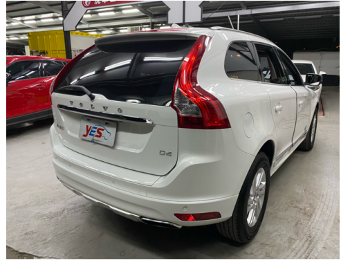
後面或右後側(含車尾)