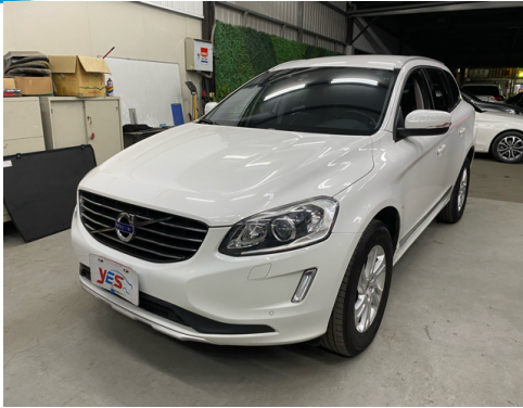
正面或左前側(含車頭)